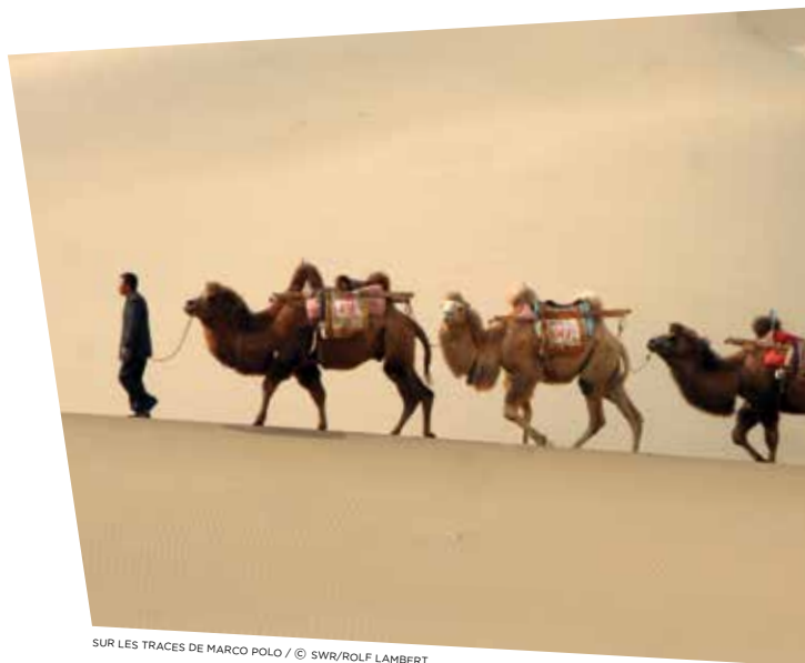
SUR LES TRACES DE MARCO POLO