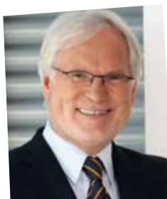
MARKUS SCHÄCHTER

TROIS ENTITÉS COMPOSENT LE GROUPE ARTE : LE GROUPEMENT EUROPÉEN ARTE GEIE, SITUÉ À STRASBOURG, ET SES DEUX MEMBRES QUI AGISSENT EN TANT QUE PÔLES D'ÉDITION ET DE FOURNITURE DE PROGRAMMES, ARTE FRANCE À PARIS (ISSY-LES-MOULINEAUX) ET ARTE DEUTSCHLAND TV GMBH À BADEN-BADEN.