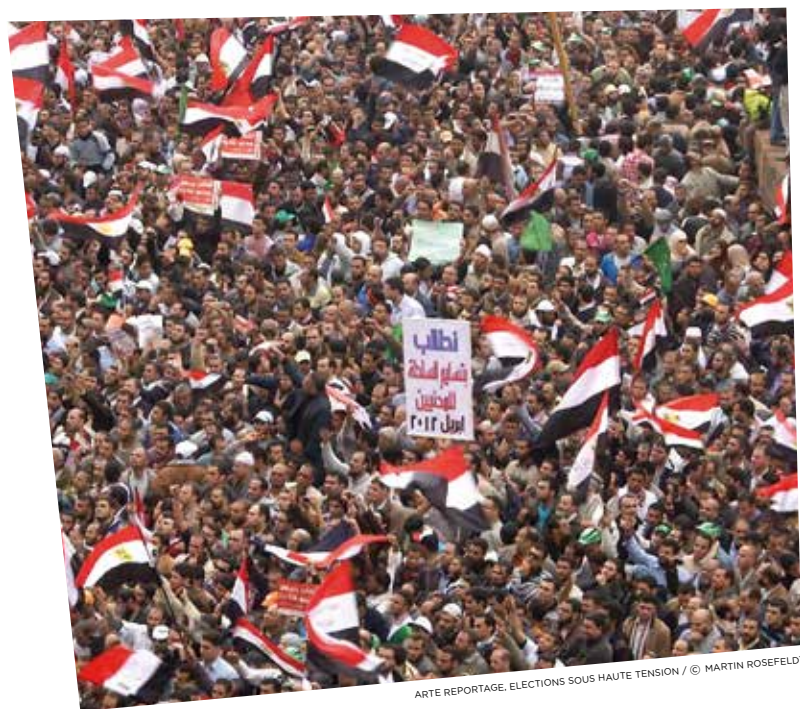
ARTE REPORTAGE, ELECTIONS SOUS HAUTE TENSION

INTERNATIONALE, EUROPÉENNE ET CULTURELLE, L'INFORMATION SUR ARTE, DERRIÈRE LE FLUX QUOTIDIEN DE L'ACTUALITÉ, DÉCRYPTE LES GRANDS ENJEUX À L'OEUVRE DANS LE MONDE CONTEMPORAIN, AUX ANTIPODES DE L'INFO-SPECTACLE.