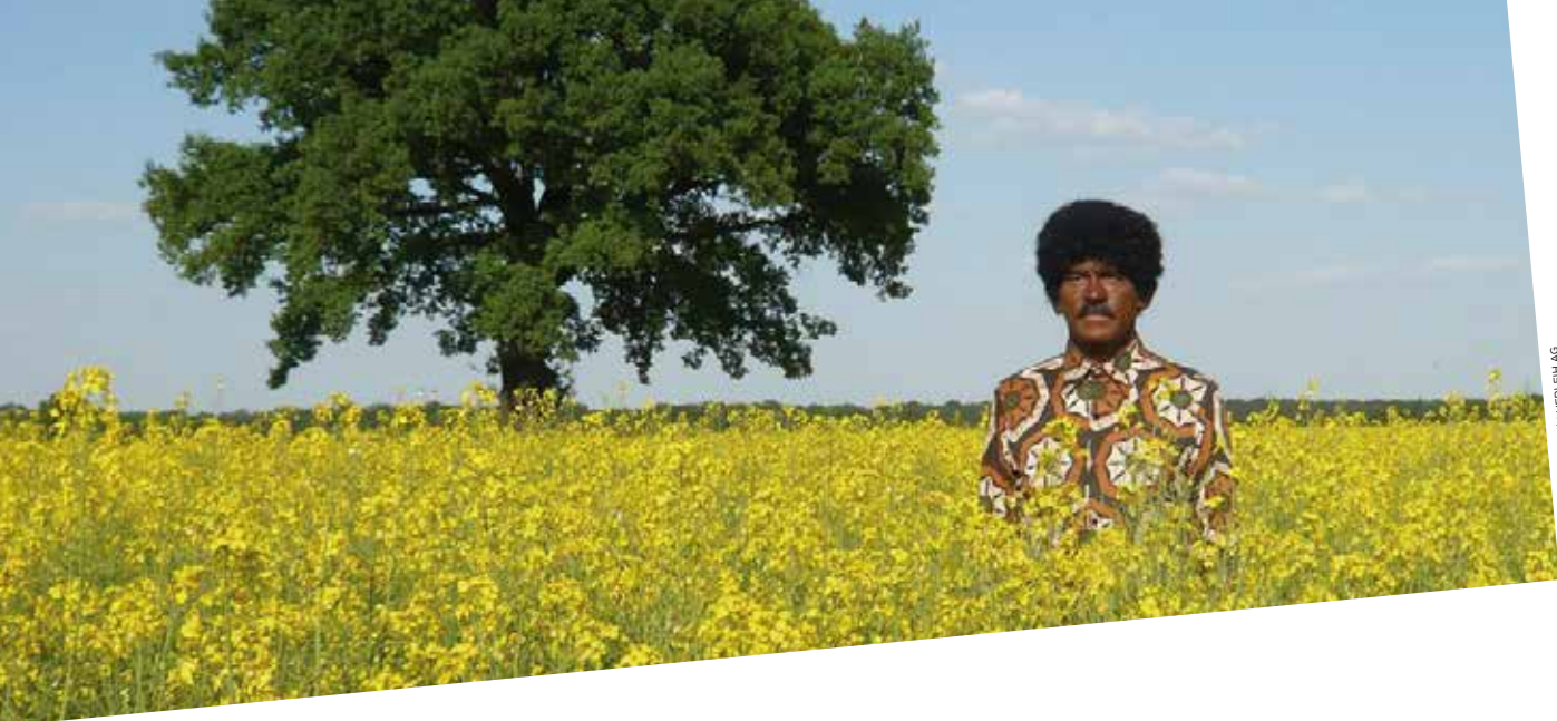
NOIR SUR BLANC / © WDR5 VERLEH AG