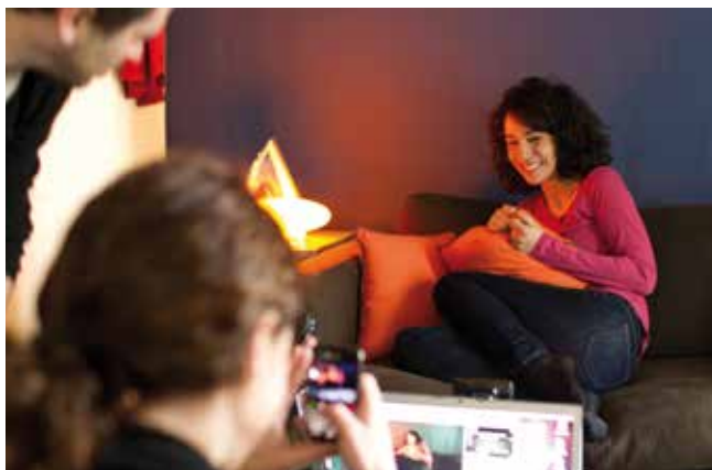
60 SECONDES