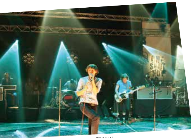
REMIX ONE SHOT NOT