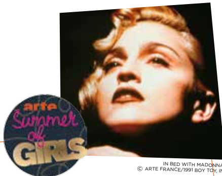
IN BED WITH MADONNA / © ARTE FRANCE/1991 BOY TOY, INC.