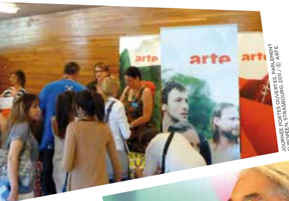
JOURNÉE PORTES OUVERTES, PARLEMENT EUROPÉEN, STRASBOURG, 2011

En 2011, ARTE a traité plus 52.400 demandes de téléspectateurs concernant la Chaîne, ses programmes ou encore les différents modes de réception. Près de 206.000 internautes ont par ailleurs choisi les services en ligne ARTE à la carte pour être informés des temps forts de la programmation selon leurs centres d'intérêts. Comme chaque année, ARTE est allée à la rencontre du public comme par exemple lors des portes ouvertes du Parlement européen à Strasbourg.