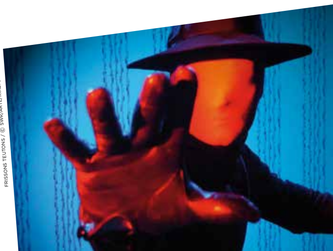
FRISONS TEUTONS

Dix ans après les attentats du World Trade Center, ARTE s'est mis à l'heure de New York Forever , le temps d'un dimanche exceptionnel, de NY Confidential au Bûcher des Vanités de Brian de Palma, en passant par le Webdocumentaire New York 3.0 . Dans Tous terroristes ? , THEMA a disséqué les lois antiterroristes mises en place depuis, quand les MERCREDIS DE L'HISTOIRE a suivi Les routes de la terreur . Avec Suicidistan , ARTE REPORTAGE a analysé les ravages des guerres en Irak et en Afghanistan chez les soldats américains. Enfin, le Webdocumentaire Afghanistan, 10 ans, 100 regards a croisé les points de vue sur cette décennie.