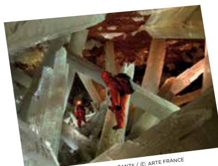
NAICA, LA GROTTA AUC CRISTAUX GEANTS