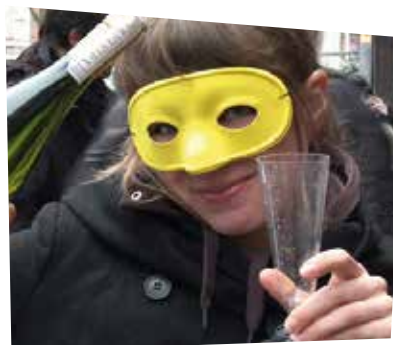
YOUROPE, QUELLES PERSPECTIVES POUR LES JEUNES DÉFAVORISÉS EN EUROPE ?