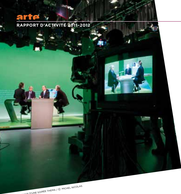
TOURNAGE D'UNE SOIRÉE THEMA