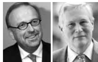
Fritz Raff / © DAS BILDERWERK, U. BARBIAN Klaus Wenger / © ARTE, FREDÉRIC MAIGROT

programmes et de la production de l'information et de certaines émissions. Il définit la communication de la Chaîne et gère les relations avec les partenaires européens.