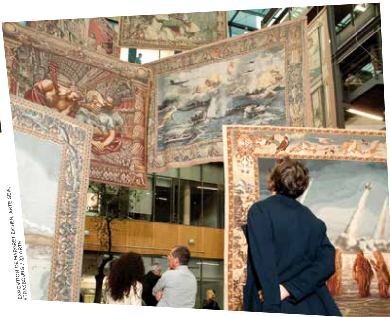
EXPOSITION DE MARGRET EICHER, ARTE GEIE, STRASBOURG

Par ailleurs, ARTE France poursuit une coopération avec treize partenaires qui diffusent ses programmes dans leurs langues nationales : ARTV au Canada, TV5MONDE et onze télévisions publiques d'Europe de l'Est, Caucase et Kurdistan. La Chaîne reste diffusée par satellite sur le pourtour méditerranéen et dans 20 pays d'Afrique francophone. Parmi les nombreuses opérations menées à travers le monde, on retiendra les ateliers d'écriture et de réalisation de documentaires en Roumanie, au Kurdistan et dans le monde arabe ainsi que la remise de Prix ARTE pour soutenir des projets de longs métrages dans une dizaine de grands festivals de par le monde (cf. page ci-contre).