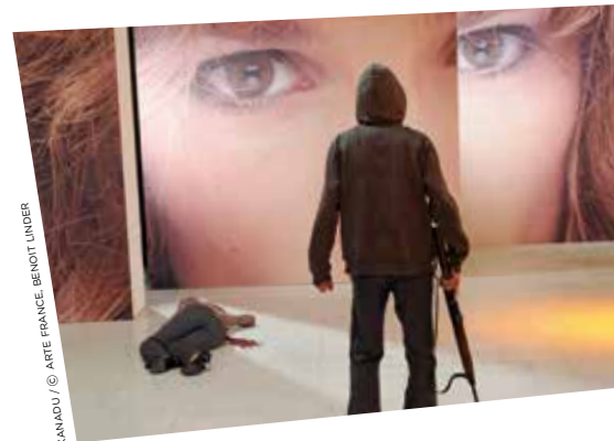
XANADU

Coproducteur et diffuseur majeur, ARTE soutient la création contemporaine, tout en programmant les chefs-d'œuvre de toujours. Pour la Berlinale, la Chaîne a consacré un cycle au cinéma gay et lesbien et une soirée de soutien au cinéaste iranien et auteur du Cercle Jafar Panahi. À l'occasion du Festival de Cannes, priorité à l'audace avec Import/Export d'Ulrich Seidl, La femme sans tête de Lucrecia Martel, ou encore The Edukators , le film maintes fois primé de Hans Weingartner, sans oublier le cultissime Orange mécanique de Stanley Kubrick. Mascarades , de Lyes Salem, Satin rouge de Raja Amari et What a wonderful world de Faouzi Bensaïdi : une journée spéciale a aussi été dédiée au cinéma arabe, tandis que pour ses 70 ans, quatre films de Bertrand Tavernier ont été programmés dont La vie et rien d'autre . Les très British Monty Python ont fait leur éternel retour, alors que Les Nibelungen , superproduction de Fritz Lang, s'affichaient en version restaurée. À l'écran encore, Everyone Else de Maren Ade, variation réussie sur un couple de trentenaires. En cadeau, Laurel et Hardy sont revenus pour les fêtes en version restaurée.