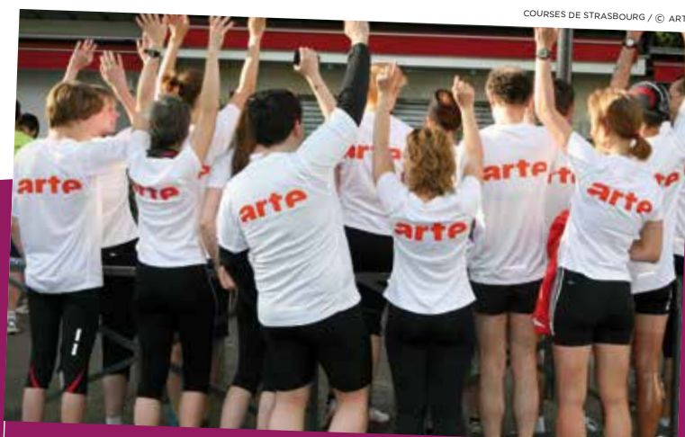
COURSES DE STRASBOURG

Comme chaque année, des opérations ont été menées pour renforcer encore la coopération transversale et le sentiment d'appartenance au Groupe ARTE des collaborateurs de la Chaîne, répartis entre la Centrale à Strasbourg, les pôles ARTE France et ARTE Deutschland à Paris et Baden-Baden ainsi que les rédactions ARTE au sein des chaînes publiques allemandes ZDF et ARD dans tous les länder. Un séminaire interculturel a réuni une soixantaine de collaborateurs à Strasbourg. Quelques échanges de personnel ont permis à des collaborateurs de la ZDF et de l'ARD de découvrir le travail de leurs collègues strasbourgeois. A l'étude également des initiatives pour favoriser la mobilité et les formations communes aux collaborateurs des différentes entités du Groupe. Une refonte de l'intranet est également en préparation. Enfin, dans le cadre de la politique de santé au travail, les collaborateurs ont été invités à une journée de sensibilisation aux risques psycho-sociaux dans l'entreprise, laquelle a occasionné des échanges très fructueux lors de tables rondes ou ateliers et a donné lieu à la rédaction d'une charte Nos différences font notre force .