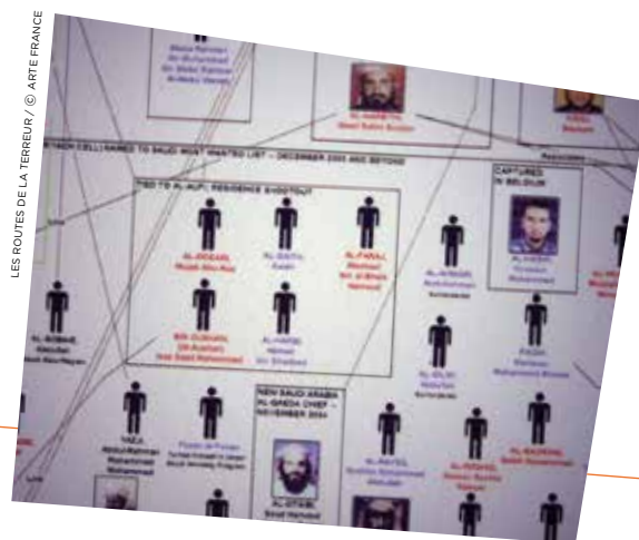
LES ROUTES DE LA TERREUR / © ARTE FRANCE

Invitation au rêve et à l'émotion, la THEMA DU DIMANCHE prend le chemin du suspense et du glamour. En 2011, pour les ex-fans des sixties, Jane Birkin a feuilleté, à travers un film en super-huit inédit, les pages de son parcours avec Serge Gainsbourg. À la même époque, l'Allemagne frissonnait devant les films Edgar Wallace, une série culte devenue phénomène de société dont Thema a démonté les rouages.