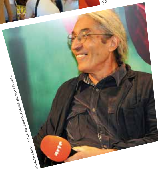
BOUALEM SANSAL, SALON DU LIVRE DE FRANCFORT, 2011