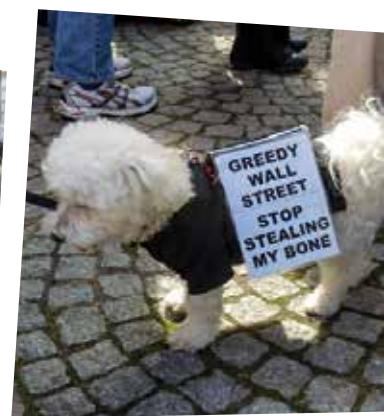
ARTE REPORTAGE, NEW YORK: OCCUPY WALLSTREET