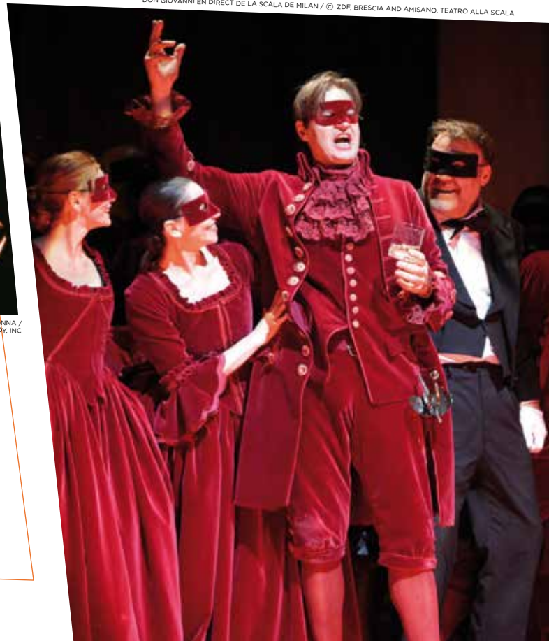
DON GIOVANNI EN DIRECT DE LA SCALA DE MILAN

En 2011, ARTE a retransmis en direct les grands événements de la scène européenne dont Anna Bolena avec Anna Netrebko et Elina Garanca, depuis l'Opéra de Vienne, et Don Giovanni de Mozart pour l'ouverture de la Scala de Milan. Dans le cadre de Vienne 1900 et pour le centenaire de la disparition de Gustav Mahler, la Chaîne a diffusé La Symphonie des mille , clôture du Festival International Mahler de Leipzig qu'ARTE Live Web retransmettait en intégralité. Deux concerts de gala ont été proposés, le premier de Weimar pour le Bicentenaire de Franz Liszt, et le second de Moscou pour la réouverture du Bolchoï, avec Angela Gheorghiu, Natalie Dessay et Plácido Domingo. Au programme aussi, les festivals de l'été, de Salzbourg à Lucerne, en passant par La Roque d'Anthéron et Aix-en-Provence où Natalie Dessay interprétait Violetta dans La Traviata . Et pour la première fois, ARTE s'est invitée à Bayreuth pour Lohengrin , mis en scène par Hans Neuenfels. De plus, la Chaîne a consacré une journée au Festival d'Avignon. Pour le Nouvel An, de Leipzig à Vienne et de Buenos Aires à Venise, ce furent 24 heures de spectacles non-stop autour du monde, alors que les concerts d'Anna Calvi au Trianon et de The Dø à La Maroquinerie ont été diffusés sur ARTE Live Web.