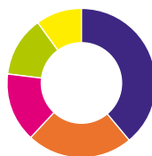
RÉPARTITION DES PROGRAMMES PAR GENRE EN 2011 (19H-1H)