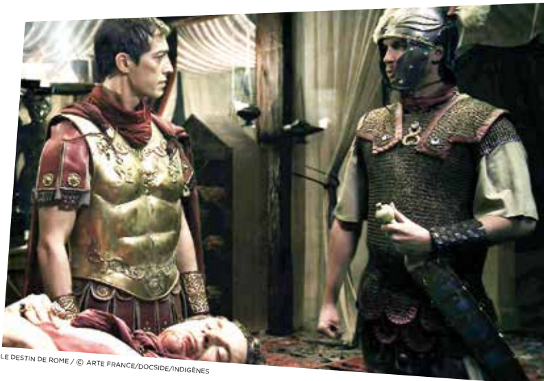
LE DESTIN DE ROME