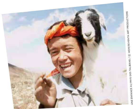
UNE ENFANCE AU PAYS DES TALIBANS