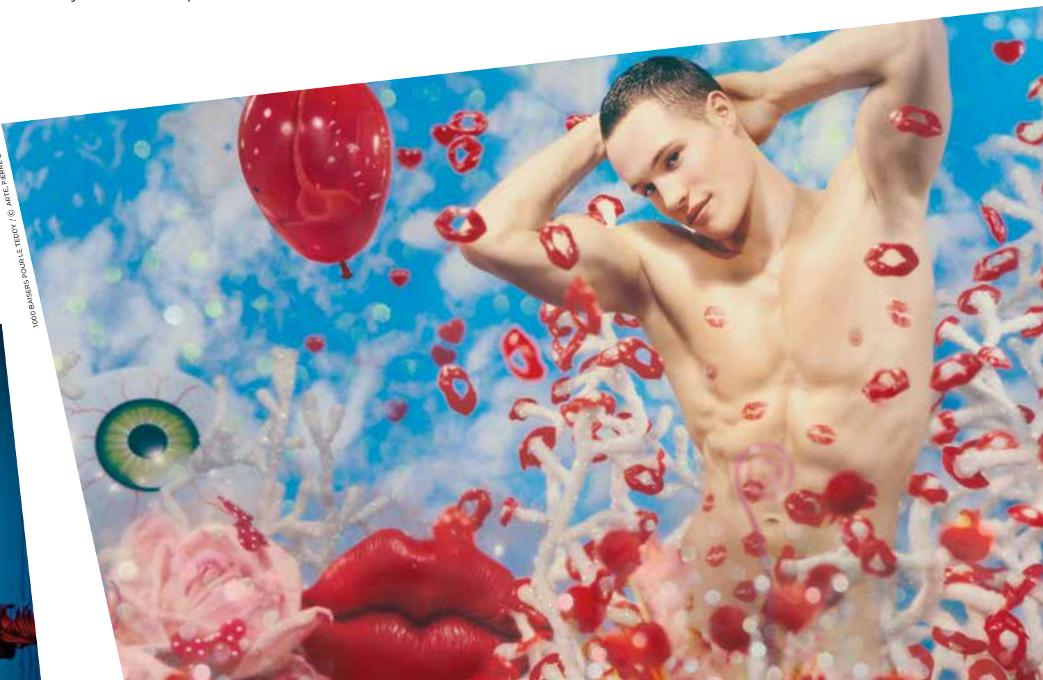
1000 BAISERS POUR LE TEDDY